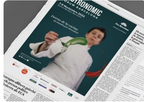
ANUNCIS PREMSA TÈCNICA / GENERALISTA