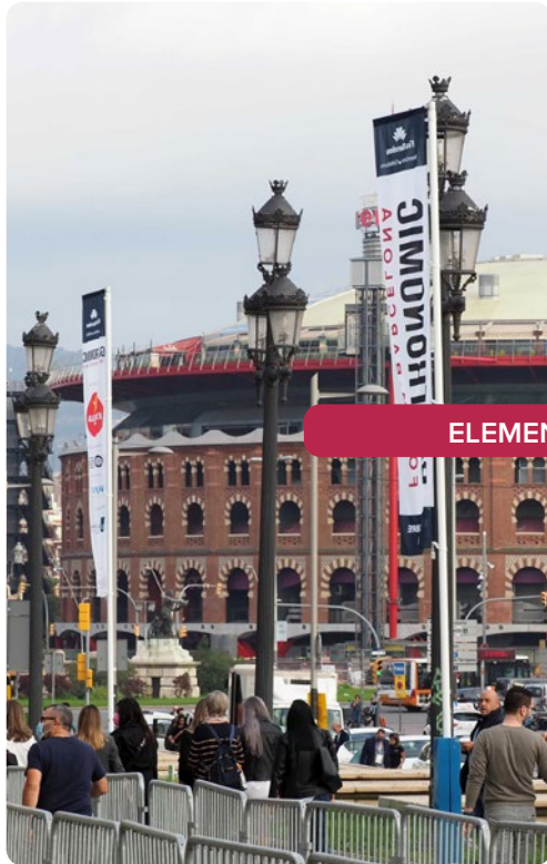
ELEMENTS DE SENYALÈTICA