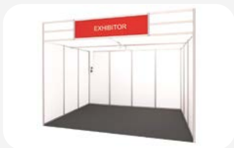
Imatge estand modular obert a 1 cara / modular stand with one open side