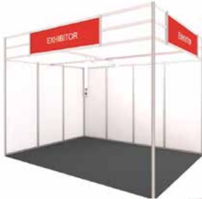
Imagen stand modular abierto a 2 caras