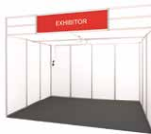
Imagen stand modular abierto a 1 cara