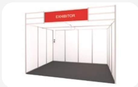
Imagen stand modular abierto a 1 cara / modular stand with one open side