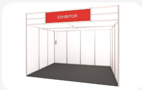
Imatge estand modular obert a 1 cara / modular stand with one open side