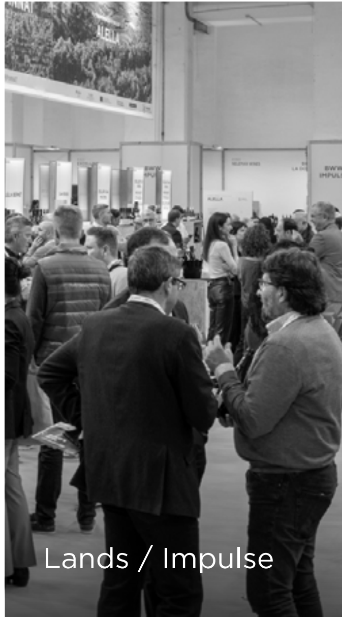
Lands / Impulse